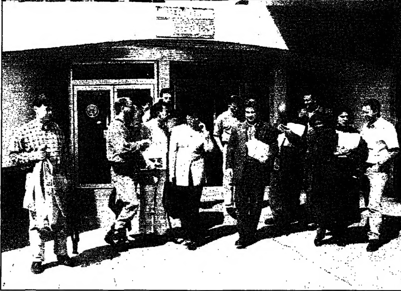
مراقبون دوليون يستعدون للاشرفات على عملية توزيع الاغذية والادوية في بغداد